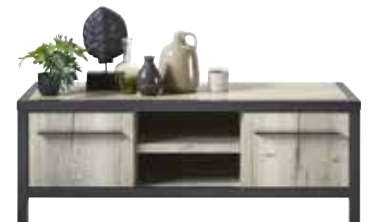
TV-meubel 2 deuren, 2 vakken H47xB130xD50cm 10317017 Maat open vak: ± H13xB40xD47cm Open vak voorzien van ronde opening voor kabeldoorvoer