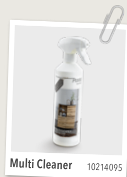
Multi Cleaner 10214095

Alle verzorgings- en reparatiemiddelen die wij in dit boekje hebben genoemd, zijn bij ons verkrijgbaar.