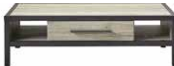
Salontafel 1 lade, 2 vakken L135xB67xH40cm 10317022 Maat open vak: ±H16xB29xD66cm