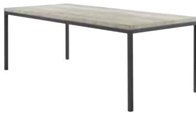
Eettafel L190xB90xH77cm 10315801 Ruimte tussen poten: ±182cm