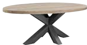
Eettafel L230xB115xH78cm 10256104

Hoogte vanaf grond tot onderkant regel is ±72cm