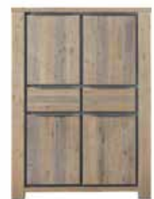
Kast 4 deuren, 2 laden H166xB121xD45cm 10256097