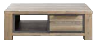
Salontafel 2 laden, 1 vak L120xB73xH41cm 10256094

Hoogte vanaf grond tot onderkant regel is ±72cm