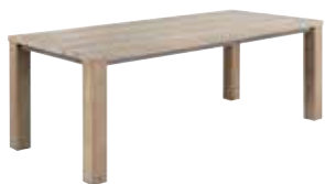
Eettafel L160xB90xH78cm ±137cm 10256100 L190xB95xH78cm ±167cm 10256101 L220xB100xH78cm ±197cm 10256102