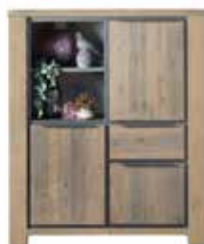
Combikast 3 deuren, 1 lade, 2 vakken H143xB121xD45cm 10256096